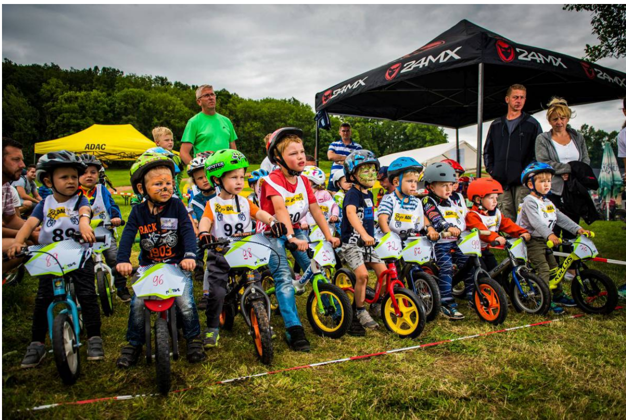
ADAC Schnuppertag am 29. 07 2017

In diesem Zusammenhang müssen alle Aktivitäten und Investvorhaben der Sektionen immer bis Ende Dezember schriftlich beim Vorstand eingereicht werden. Spätere Anträge können nicht mehr berücksichtigt werden.