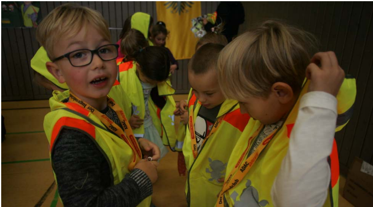
Übergabe der ADAC Sicherheitswesten 22.09.2017