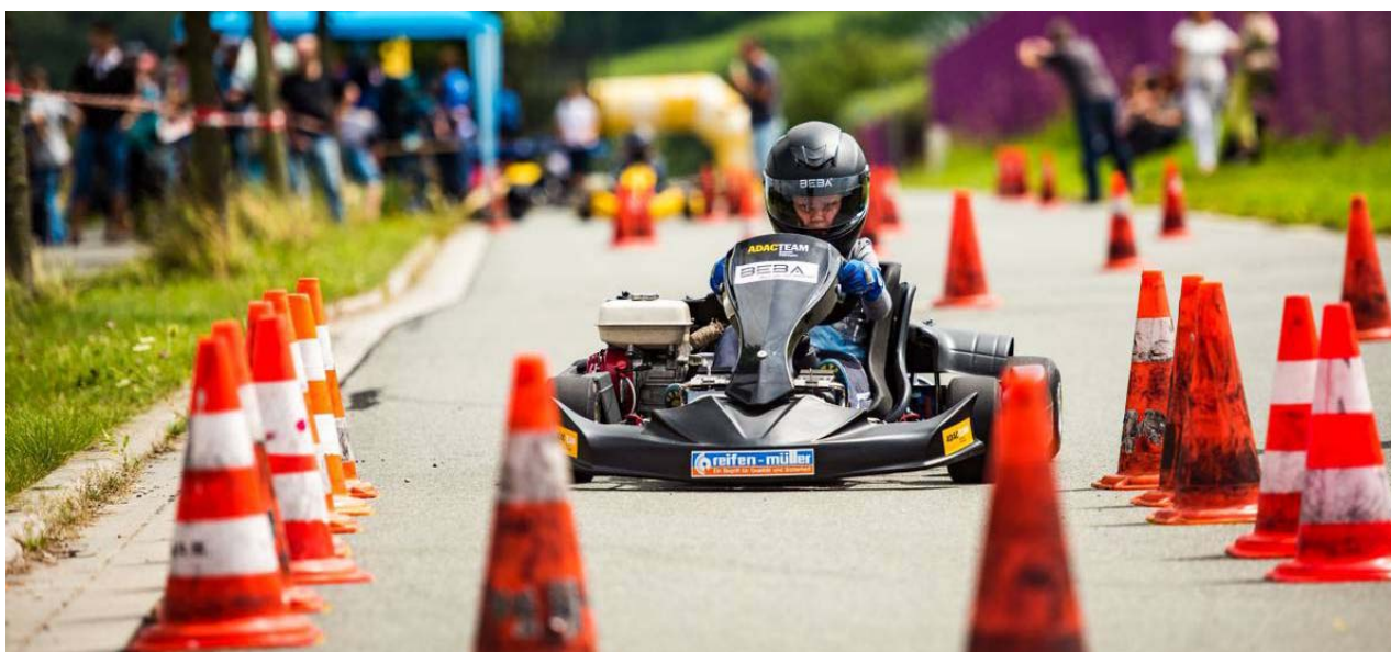
ADAC Schnuppertag am 29. 07 2017

Über die wichtigsten Vereinsaktivitäten und deren Ergebnisse waren wir mit 14 Berichten in der Lokalpresse präsent. Weiterhin wurde in einem Beitrag des Jena-TV über unsere Arbeit berichtet.